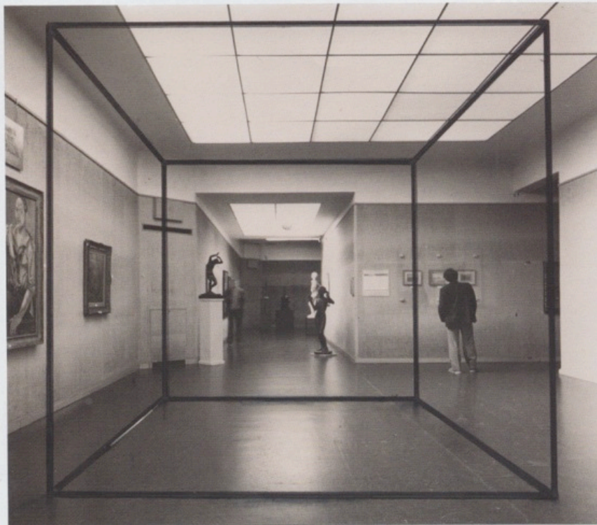
Juan Pablo Renzi Prisma de aire (Materialización de las coordenadas espaciales de un prisma de aire), 1967 Fotografía blanco y negro de Norberto Puzzolo, intervenida con marcador negro. 14 x 16,5 cm. Galería Henrique Faria