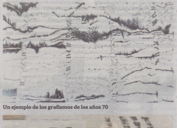
Un ejemplo de los grafismos de los años 70