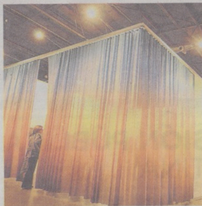
Air. De la artista brasileña Lucía Koch: US$ 35.000