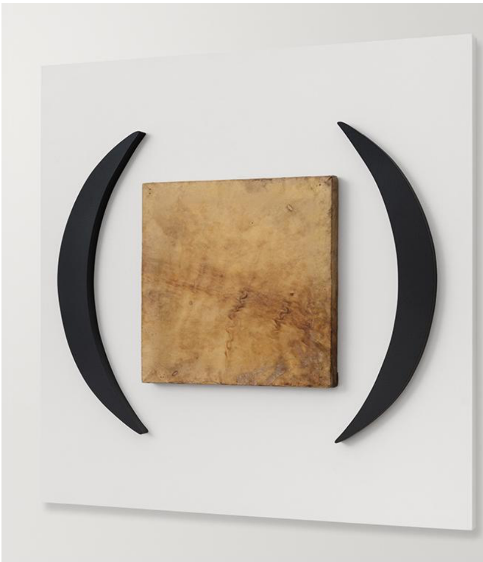
Monocromo de cuero II, 2019