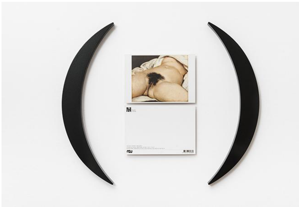
El origen del mundo entre paréntesis (Gustave Courbet) 2016

Es que nos encontramos frente a un artista cuyo sentido crítico y su compromiso ético se ha mantenido intacto desde aquellos primeros pronunciamientos dentro del Grupo de los 13 liderado por Jorge Glusberg y el CAYC en los 70', donde un elemento en " 300 metros de cinta negra para enlutar una plaza pública, 1972 " lleva un mensaje de luto volviendo visible una masacre como la de Trelew acaecida en esos mismos años. Un repaso por sus definiciones sobre el arte y sus obras vuelve a dar sentido a este nuevo recorrido. En 1973 publica Texto N° 1 en una exposición en la galería Arte Nuevo donde aparece una afirmación que se mantiene: " Un lenguaje poético es un sistema de significación para comunicar ideas ", allí también aclaraba que dentro de este sistema se hace necesario combinar la investigación, las búsquedas por fuera de la especificidad del arte y una ideología clara. La idea era producir un arte crítico, pero no sólo en relación con los conflictos sociales sino también con respecto al arte mismo, a la especificidad del lenguaje artístico y poético, algo que su vasta producción conserva usando esa pulcra determinación por dar a cada material una idea que conceptualice un mensaje.