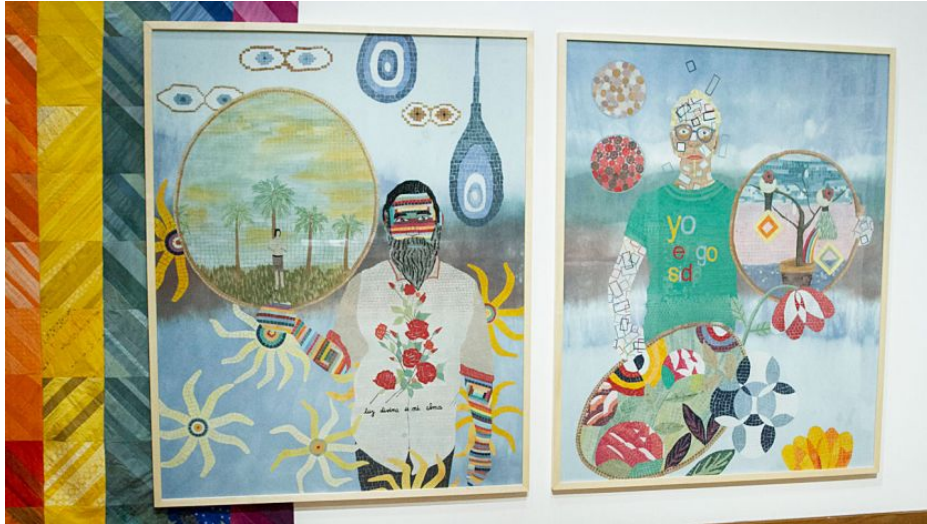
Laboratorio. La propuesta se despliega en diez salas bajo los siguientes ejes temáticos: Territorio, Estado, Diversidad, Comunidad, Gobierno, Ciudadanía, Libertad, Ética, Poder, Futuro, Equidad, Justicia, Conflicto, Consenso, Derechos Humanos, Verdad, Libertad de expresión y Soberanía.