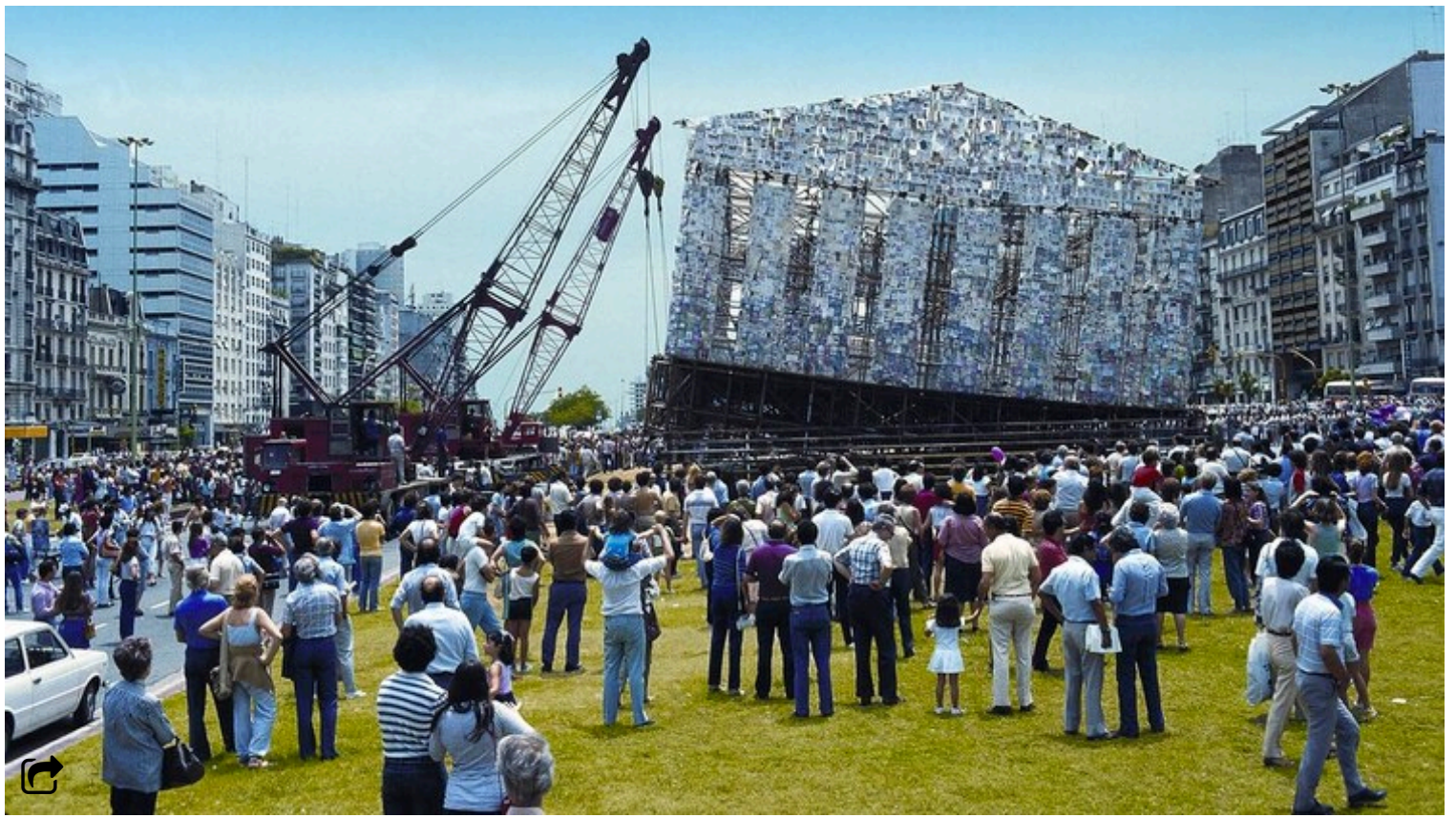
El Partenón de los Libros

En 1985, Minujín incluyó a Andy Warhol en una pieza de performance; "Pagando la deuda externa argentina con maíz", mientras que en 1996 en Londres, usando los mismos principios y una actriz interpretando a la ex primera ministra británica Margaret Thatcher, creó "Resolviendo el conflicto internacional con el arte y el maíz".